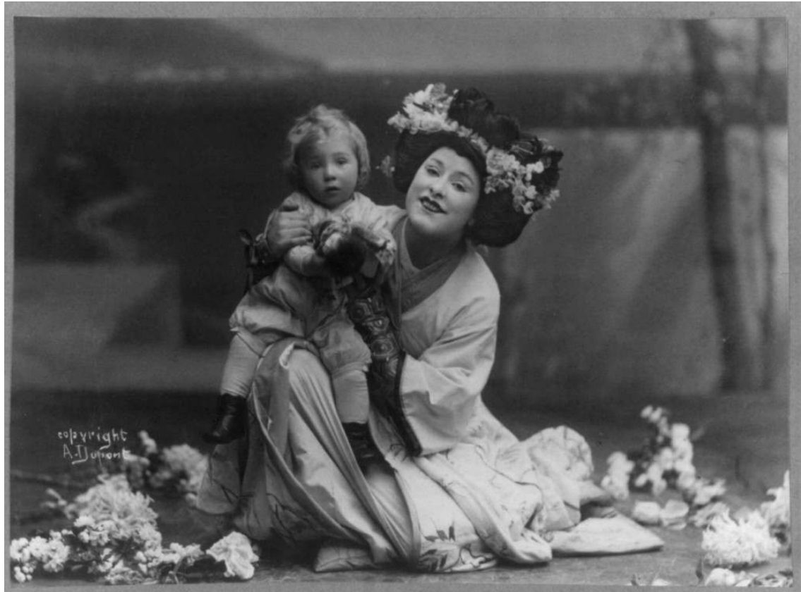
杰若婷·法若（Geraldine Farrar, 1882-1967）在歌剧《蝴蝶夫人》（Madam Butterfly）中抱子跪地的剧照。