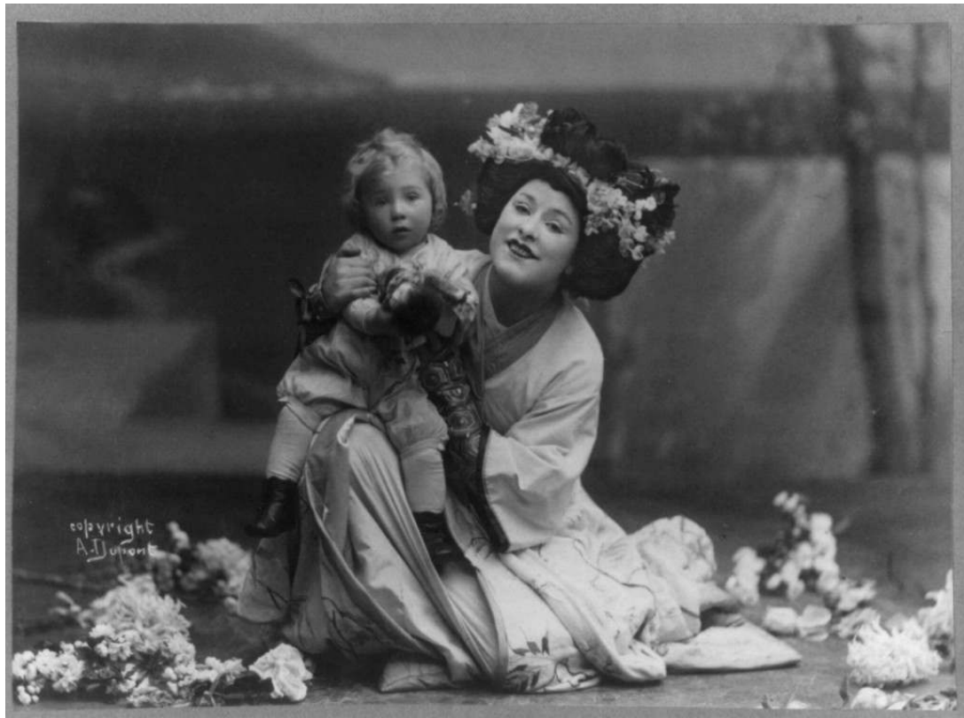
傑若婷·法若（Geraldine Farrar，1882-1967）在歌劇《蝴蝶夫人》（Madam Butterfly）中抱子跪地的劇照。